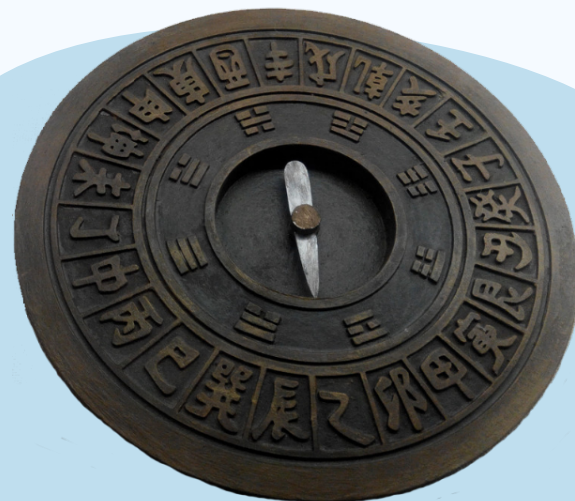
中国古代航海 用的罗盘