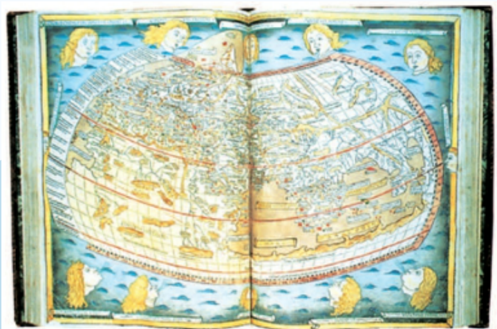
托勒密《地理学指南》 中的世界地图