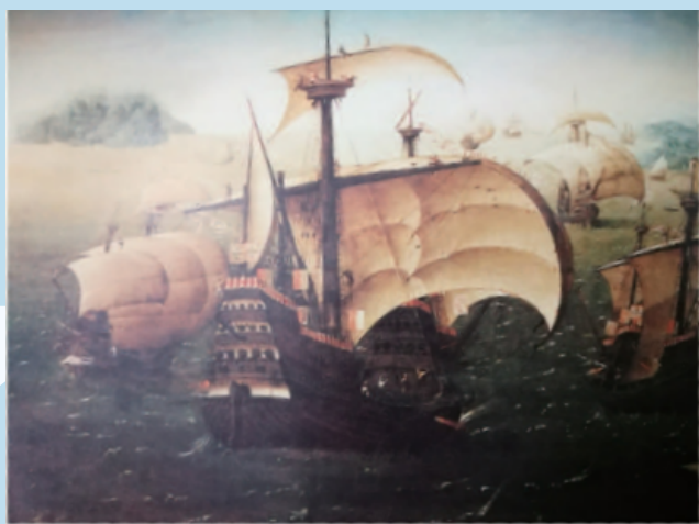
15-16世纪葡萄牙 宽身帆船