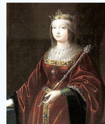
西班牙 伊莎贝拉一世

西班牙女王 伊莎贝拉一世 为支持远洋航行，不仅掏净了国库，甚至卖掉了自己王冠上的珠宝。在王后的鼎力支持下，哥伦布率领三艘帆船开始了远航。