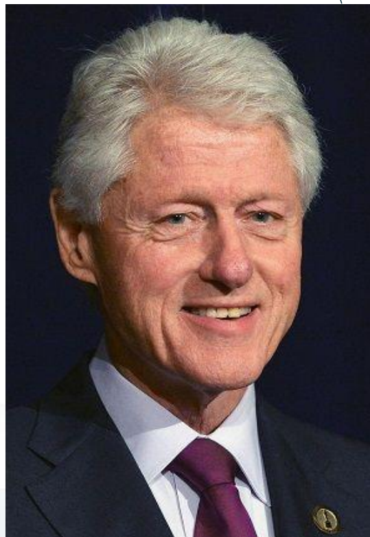
克林顿 第42任美国总统