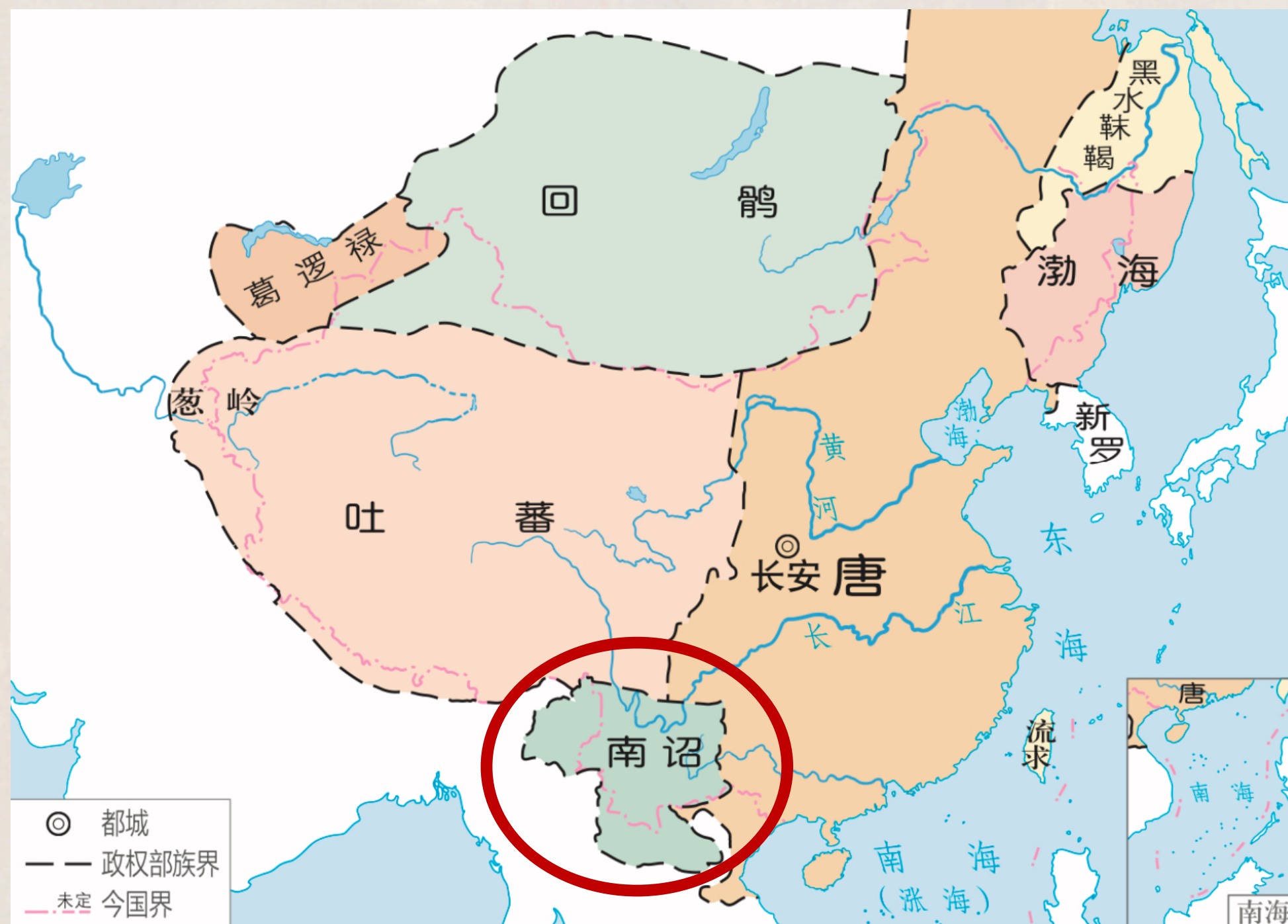
唐朝后期形势和边疆各族分布图（820年）