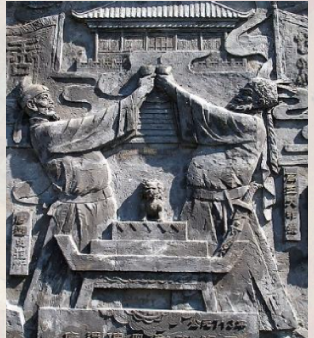
唐玄宗与大祚荣浮雕

受封后的渤海国与唐朝经贸往来频繁，多次派遣学生到唐朝求学，经济文化发展很快，被称为“海东盛国”。