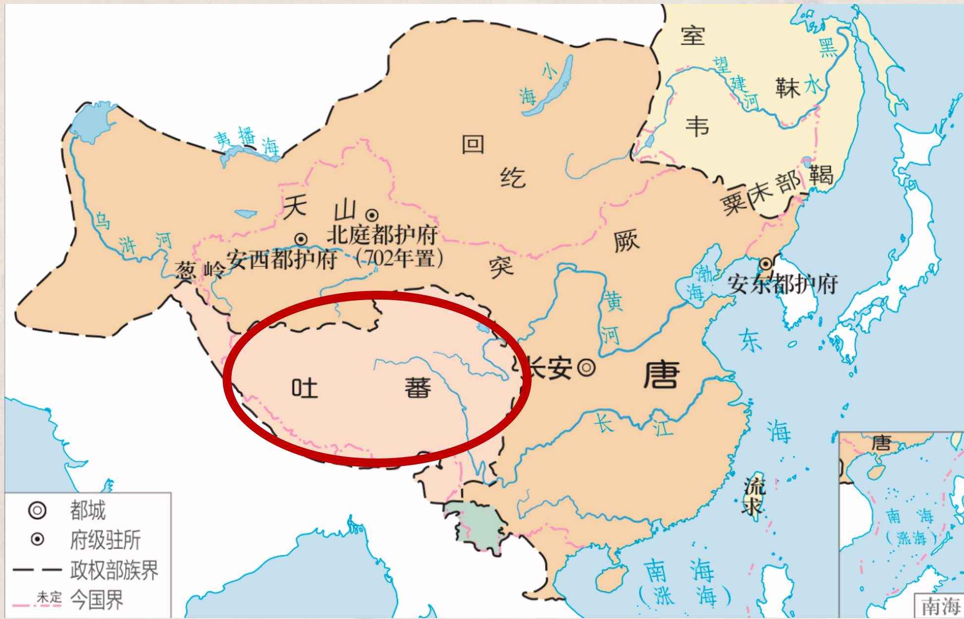
唐朝前期形势和边疆各族分布图（669年）

唐太宗 时期，吐蕃赞普 松赞干布 统一了 青藏高原 的各个部落，定都 逻些 （今西藏拉萨）。他实行了一系列发展生产、改革和完善制度的措施。