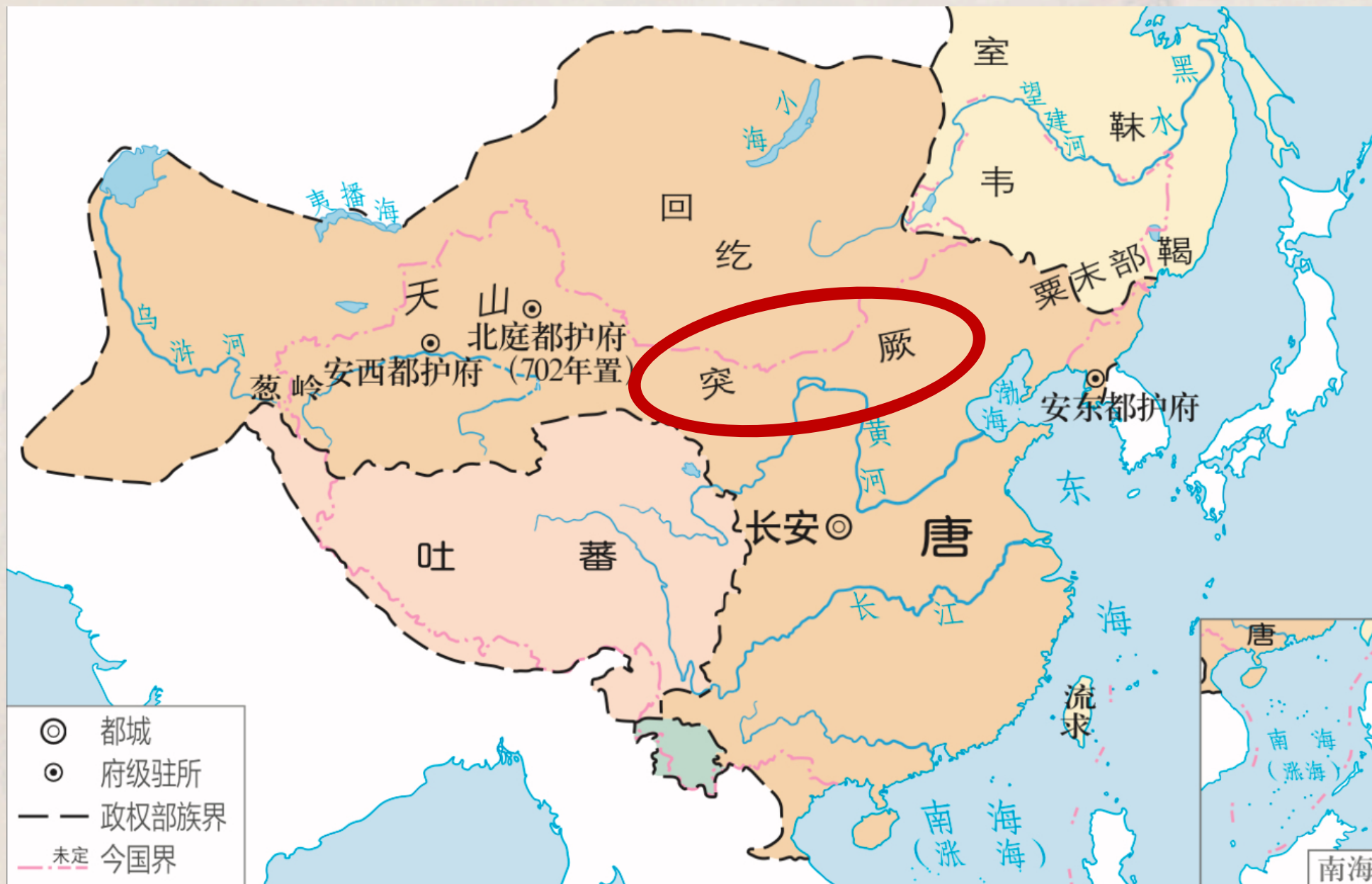
唐朝前期形势和边疆各族分布图（669年）