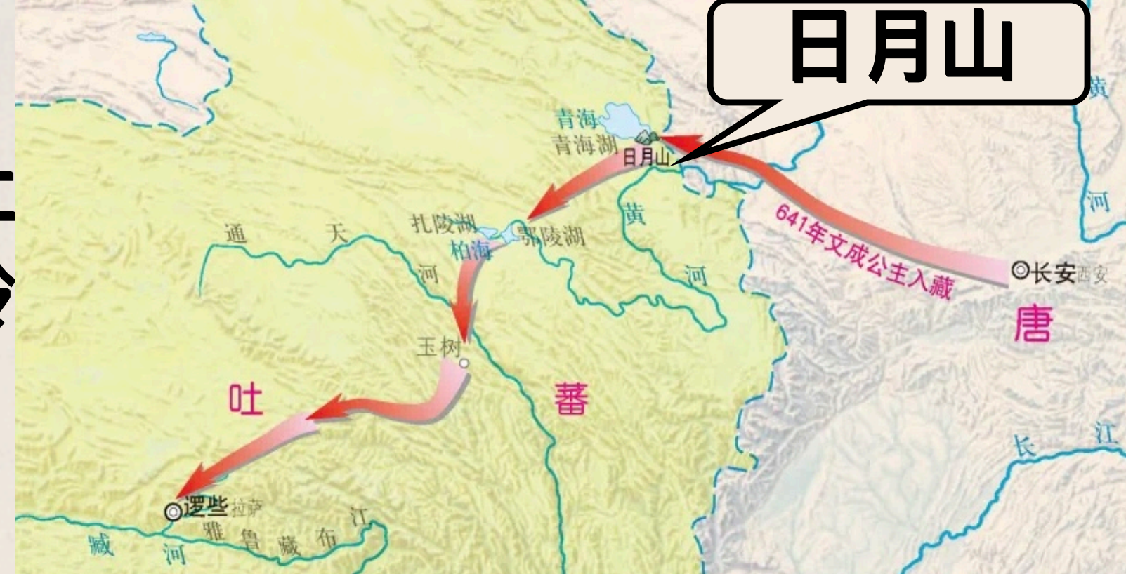
文成公主入藏路线