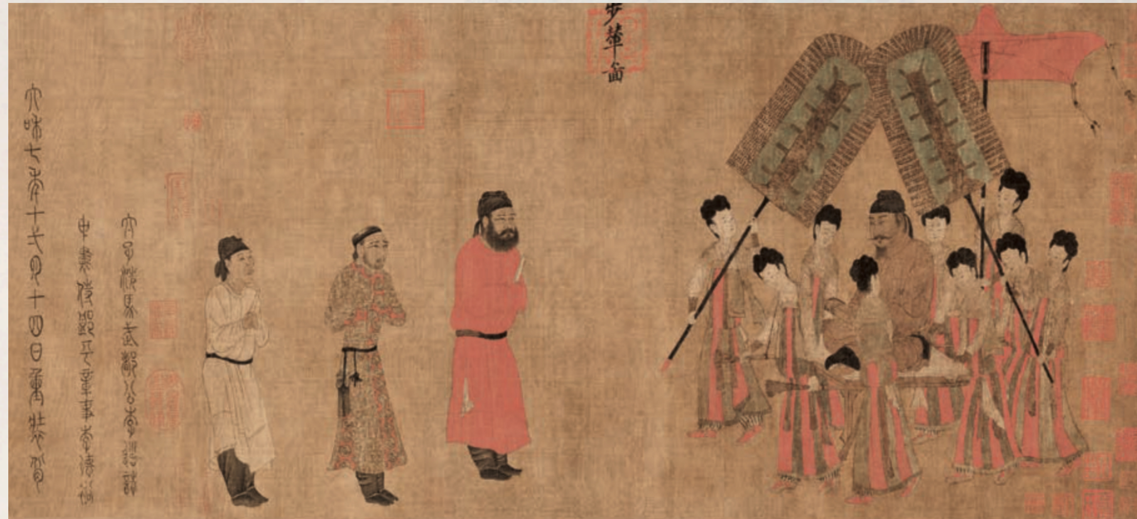
唐朝阎立本《步辇图》（局部）