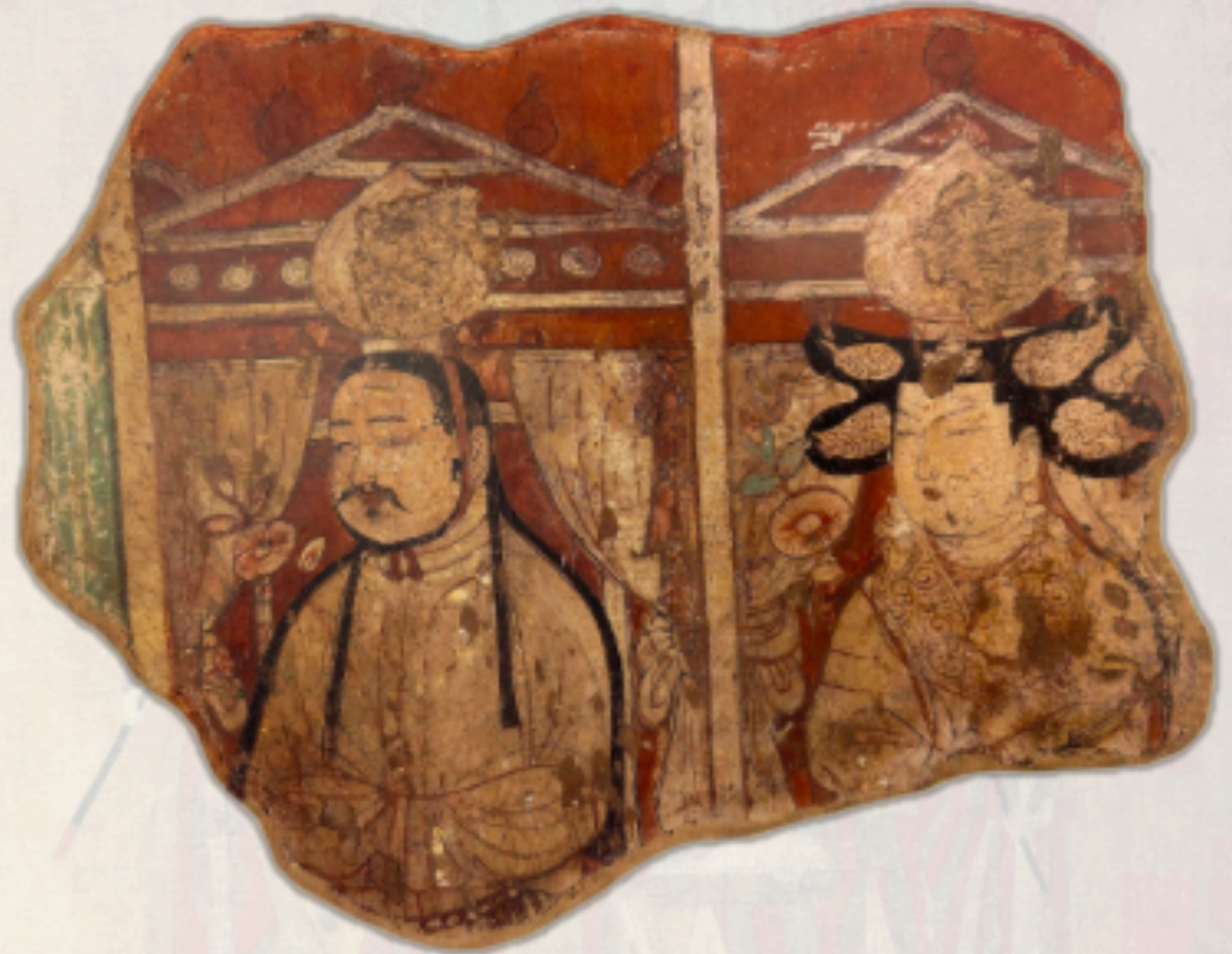
回鹘贵族夫妇壁画

回鹘人到唐朝经商的很多，仅住在长安城里的回鹘商人，就有上千名。他们用马匹和皮毛，换取汉族的绢、茶和粮食。长安、洛阳的汉人受回鹘风俗影响，喜欢穿回鹘服装，有诗说“回鹘衣装回鹘马”，正是当时市面上常见的景象。