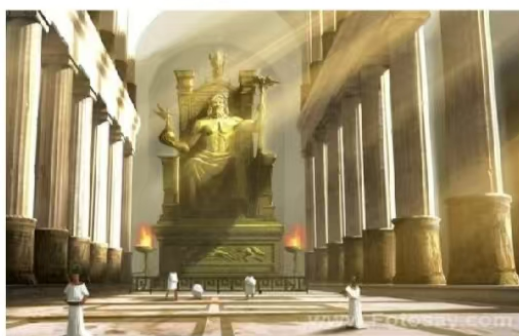
宙斯像——古代世界七大奇迹之一