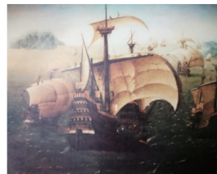
15-16 世纪葡萄牙宽身帆船