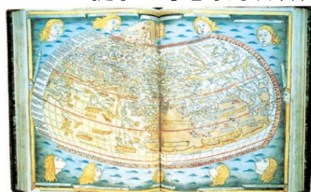
托勒密《地理学指南》中的世界地图