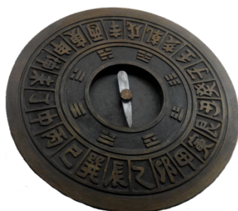
中国古代航海用的罗盘