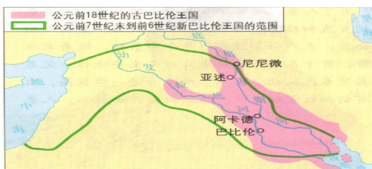
古代两河流域示意图（约公元前3500—前539）